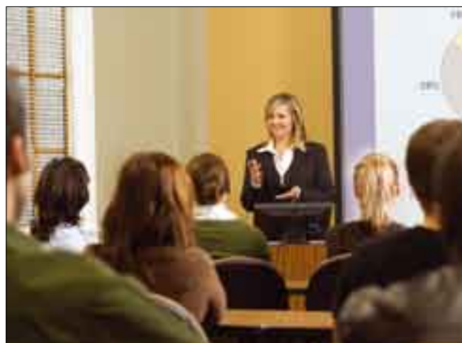
Bedienen Sie alle Programme und schreiben Sie Notizen auf den LCD-Bildschirm, während Ihre Studenten die Projektion an der Wand verfolgen.