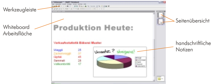
Bildschirm SMART Notebook Software

Dank der interaktiven Whiteboard Software von SMART können Sie den Computer mit dem Finger bedienen und über jede Anwendung schreiben. Mit der SMART Notebook Software verfassen und bearbeiten Sie Notizen und speichern alle Informationen in einer Datei ab. Der SMART Videoplayer ermöglicht Ihnen über Videos zu schreiben und mit dem SMART Recorder können Sie Daten und Audiosignale in einer Video-datei abspeichern.