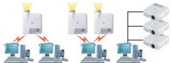
Kabellose Bildübertragung von mehreren PCs auf einen Projektor.